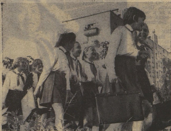
Москва, 1 сентября 1971 года.