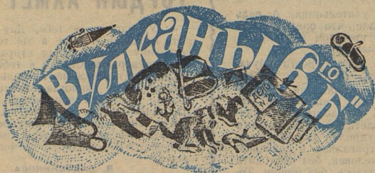
Рис. Е. МЕДВЕДЕВА.

— А тебе что! — Глупый ты! — Умаяла нашлась... — Нашлась. Посмотри в глаза!