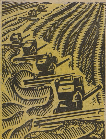
Рисунки Е. ЛИТВИНОВА.

В ту минуту, когда ты читаешь газету, ложитесь в поле под ножи комбайнов спелая пшеница и неумолимые тракторы уже стелют за собой чёрные ленты новой пашни. Хлеба нынче созрели поздно, а жатва идёт быстрее, чем в прошлом году. Это потому, что ещё больше стало хороших машин, умнее организован труд на полях. Первый урожай пятилетки заботит и радуется всю страну.